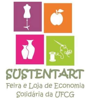
Figura 1 - Identificação dos EES da SUSTENTART

A SUSTENTART (Feira e Loja de Economia Solidária Sustentável) constitui-se de um espaço de comercialização, artesanato e alimentos naturais, produzidos pelos empreendimentos participantes do Fórum Regional de Economia Solidária do Agreste da Borborema, na Paraíba. A Figura 1 apresenta a logomarca escolhida pelos Empreendimentos Econômicos Solidários (EES) participantes da Feira e Loja SUSTENTART.