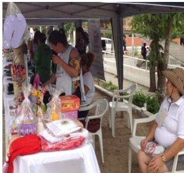
Figura 2 – Feira SUSTENTART

A Figura 2 apresenta a Feira SUSTENTART em funcionamento na Universidade Federal de Campina Grande, localizada em frente ao Restaurante Universitário.